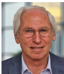
Christoph Böck Erster Bürgermeister